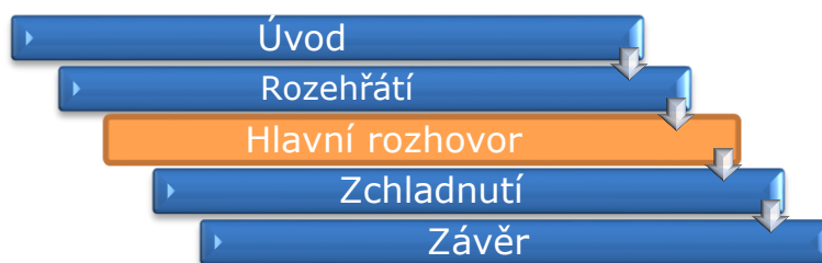
Graf č. 1: Schéma průběhu polo-strukturovaných rozhovorů